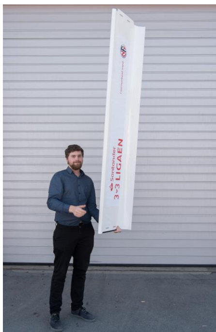
Bild 2. Sargen byggs av 22 st. paneler som är lätta att hantera.