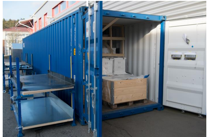
Bild 5. Lastning av 18 st. SkandiaBanen för transport till Telenor Arena i Oslo.