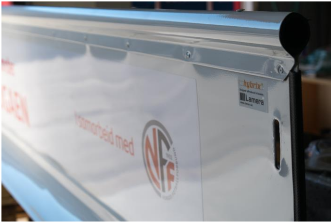
Bild 4. Detalj av panel till SkandiaBanen.