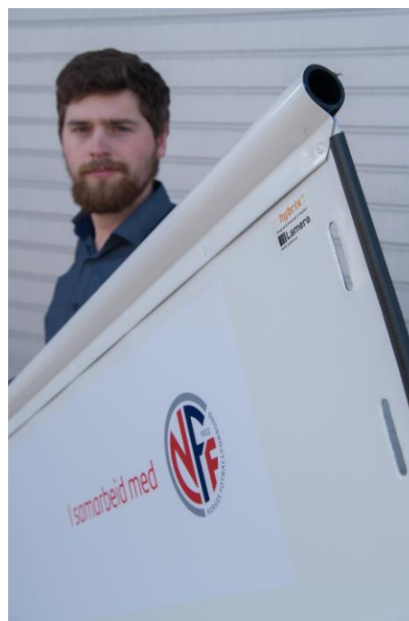
Bild 3. Detalj av SkandiaBanen och en av Lamera AB's konstruktörer som jobbar med projektet.